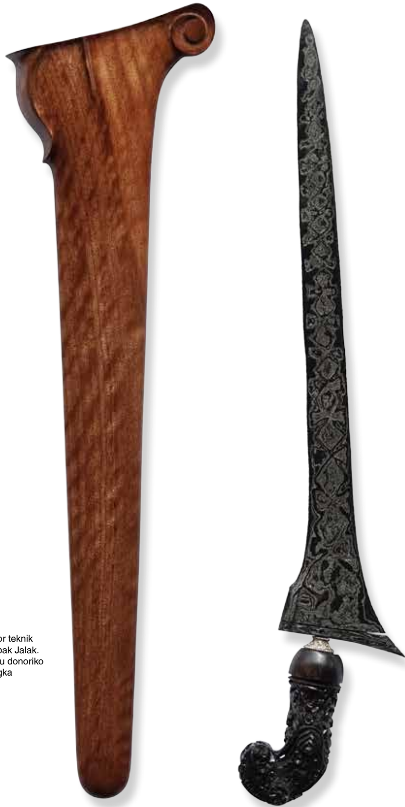
Keris dhapur Brojol, pamor teknik rekan gedhegan motif Tapak Jalak. Dipasangkan dengan Hulu donoriko gaya Madura dan warangka sandang walikat.