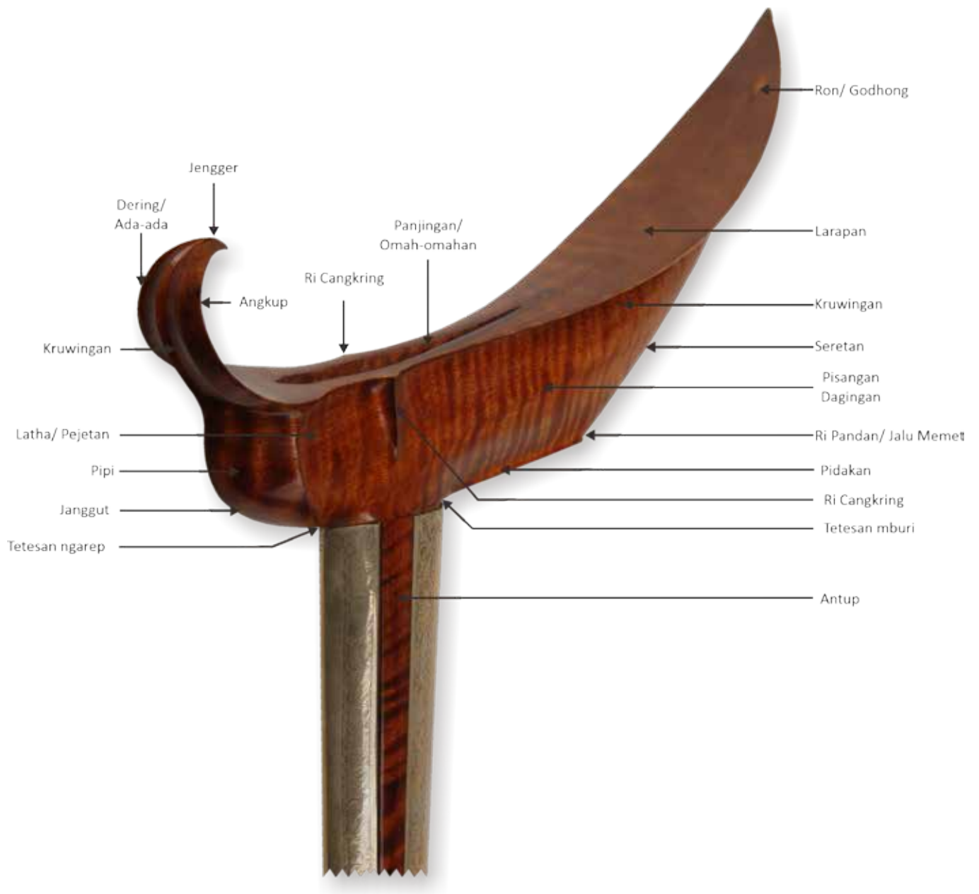
Rincikan warangka ladrang gaya Surakarta