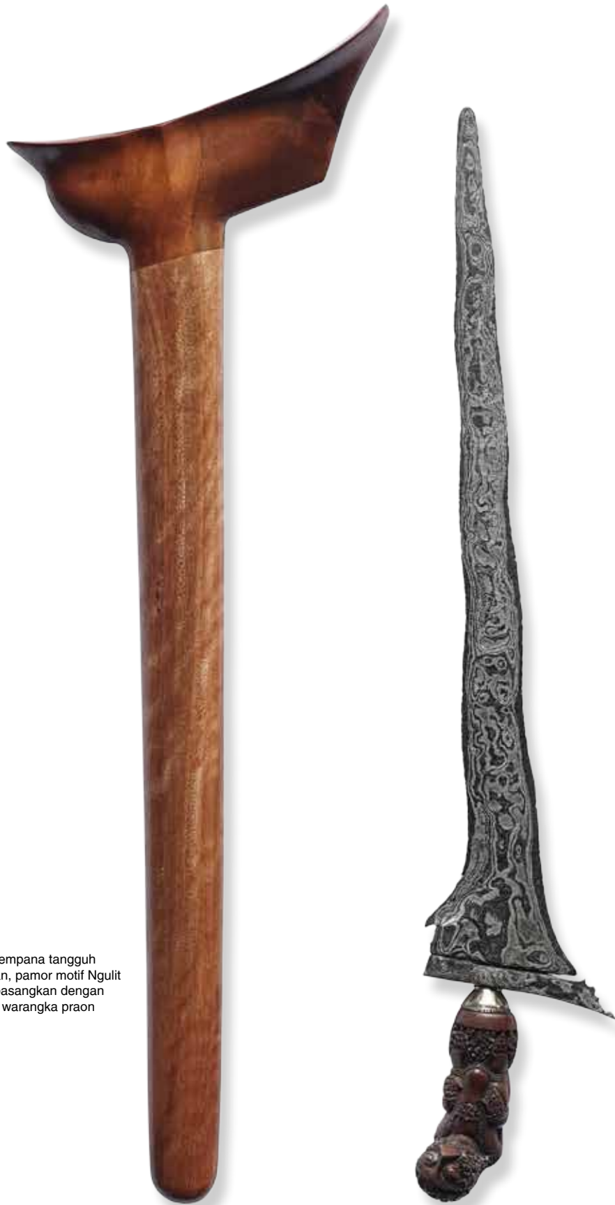
Keris dhapur Sempana tangguh Sunda Pajajaran, pamor motif Ngulit Semangka. Dipasangkan dengan hulu butha dan warangka praon gaya Cirebon.