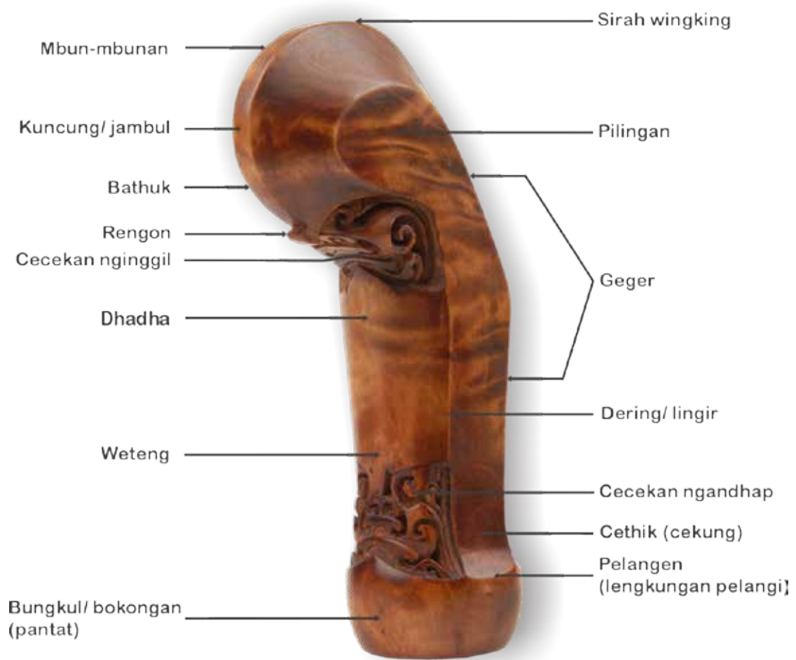
Rincian hulu nunggak semi gaya Surakarta