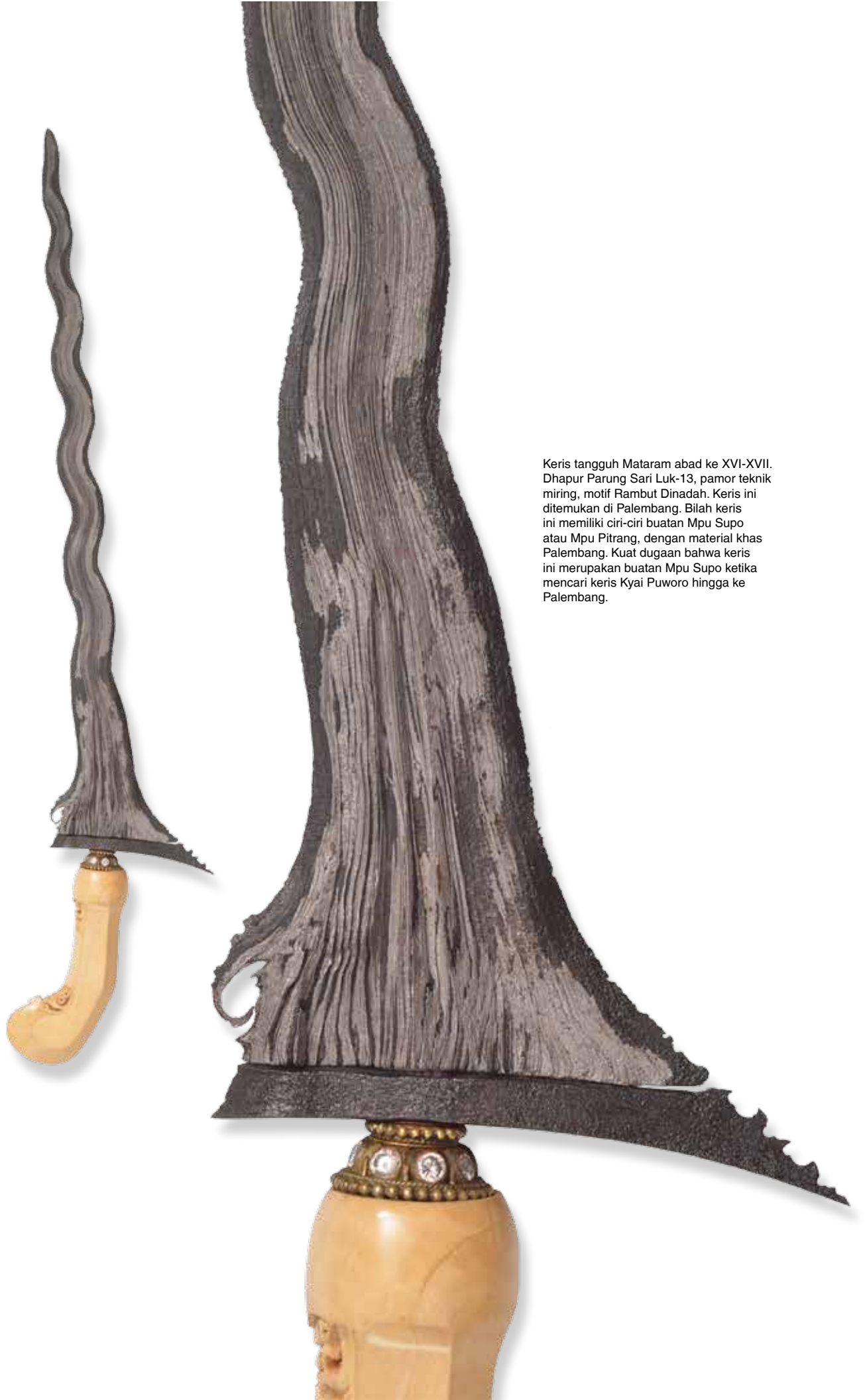
Keris tangguh Mataram abad ke XVI-XVII. Dhapur Parung Sari Luk-13, pamor teknik miring, motif Rambut Dinadah. Keris ini ditemukan di Palembang. Bilah keris ini memiliki ciri-ciri buatan Mpu Supo atau Mpu Pitrang, dengan material khas Palembang. Kuat dugaan bahwa keris ini merupakan buatan Mpu Supo ketika mencari keris Kyai Puworo hingga ke Palembang.