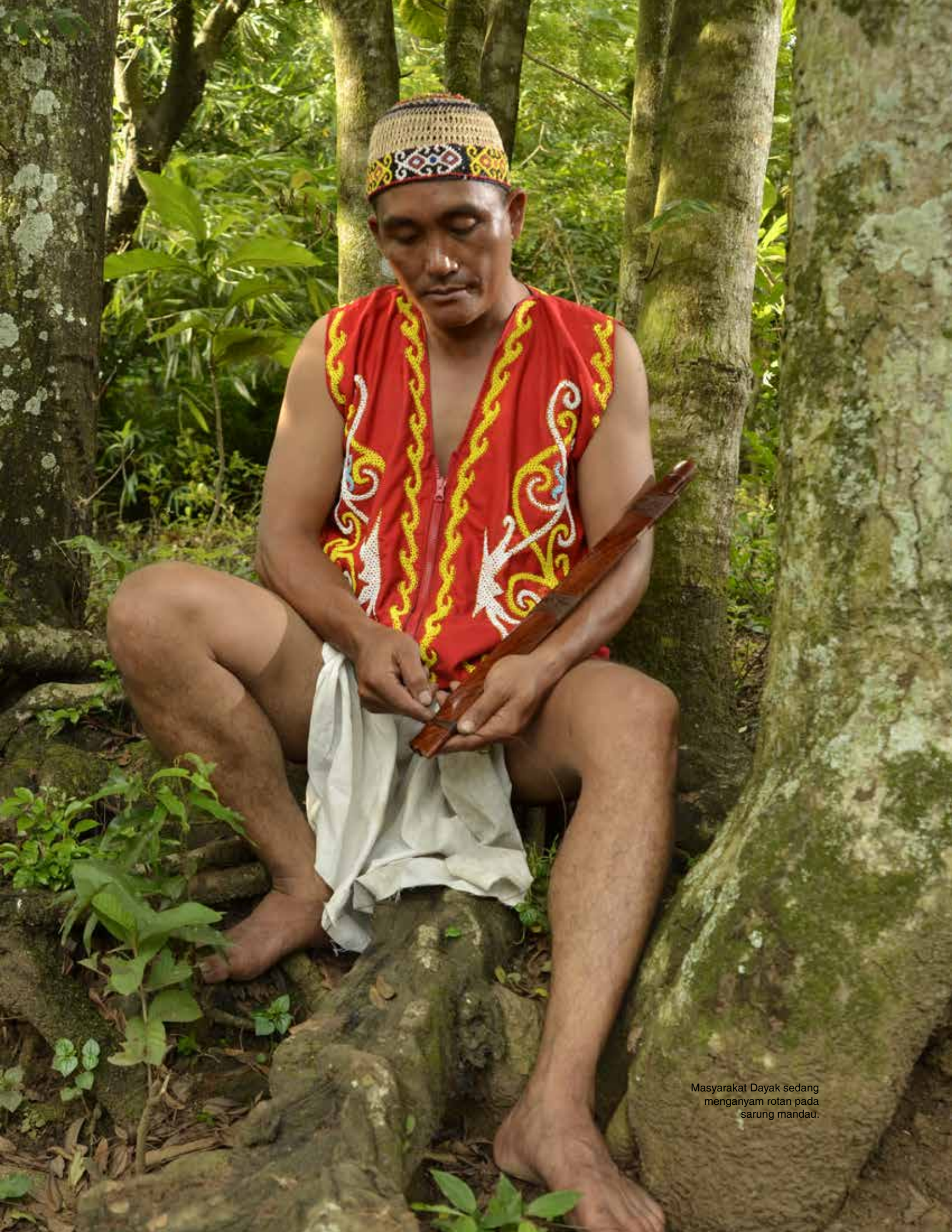
Masyarakat Dayak sedang menganyam rotan pada sarung mandau.