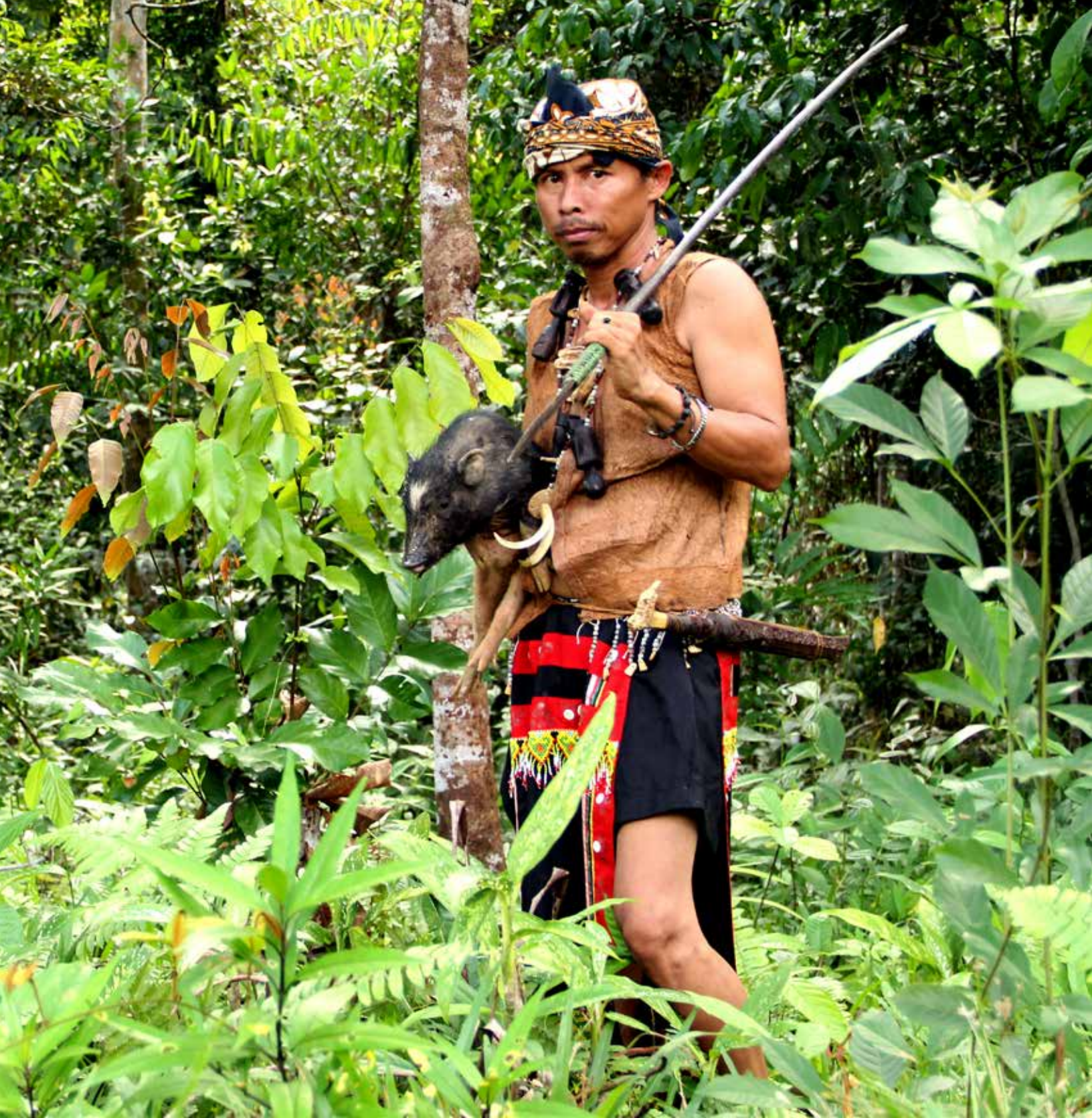
Orang Dayak Tunjung sedang berburu dengan membawa tombak.