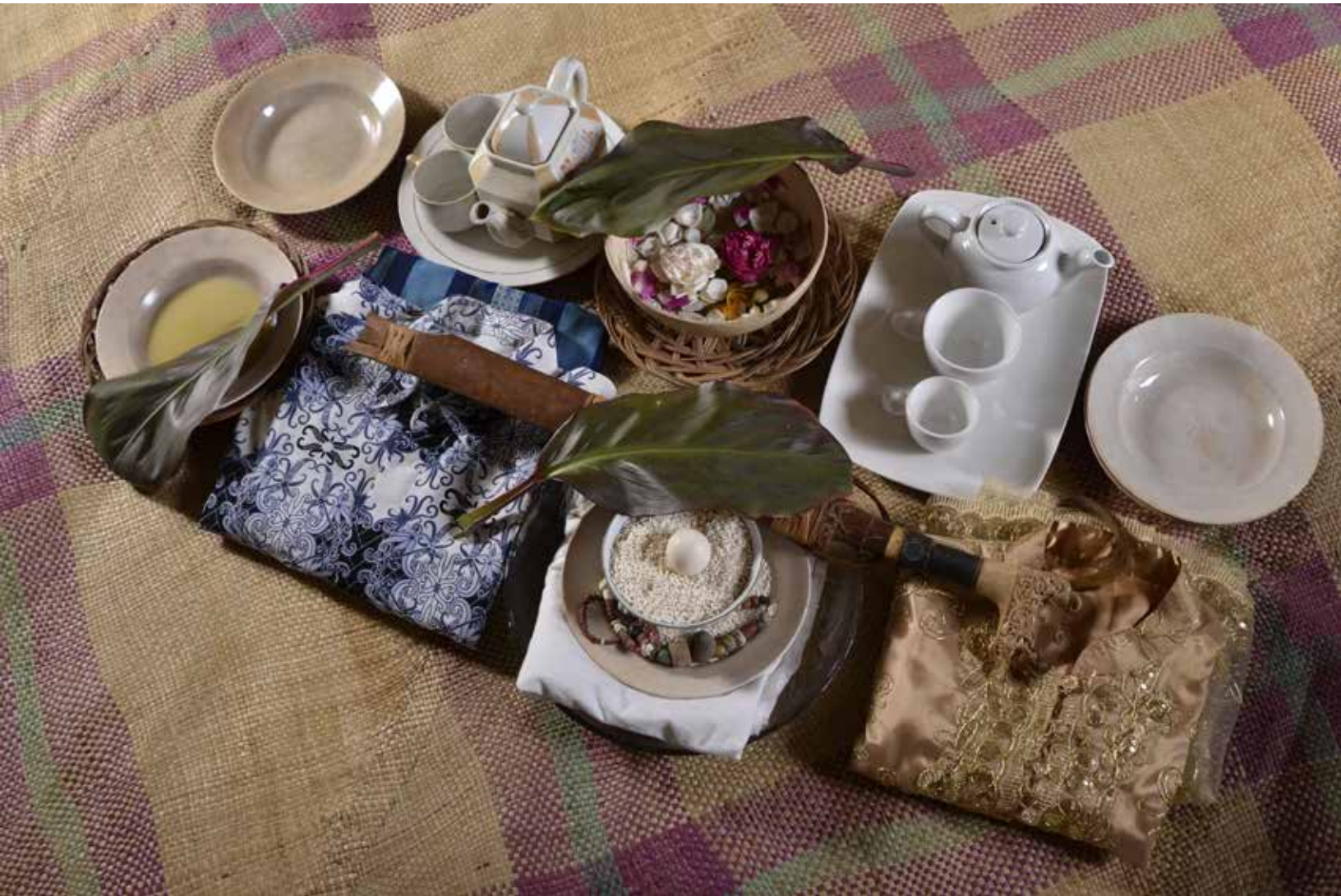
Sesaji masyarakat Dayak, lengkap dengan mandau, piring dan mangkok putih serta beras.