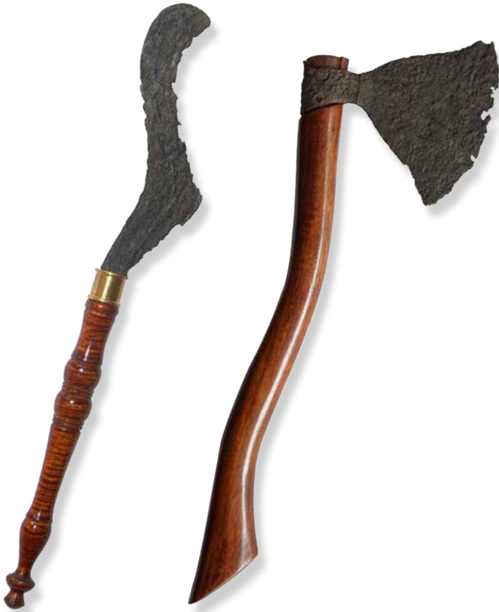
Wasi-wasi prakara yang ditemukan di Sungai Bengawan Solo. (dari kiri ke kanan) kudi, kapak, pahat, dan pisau.