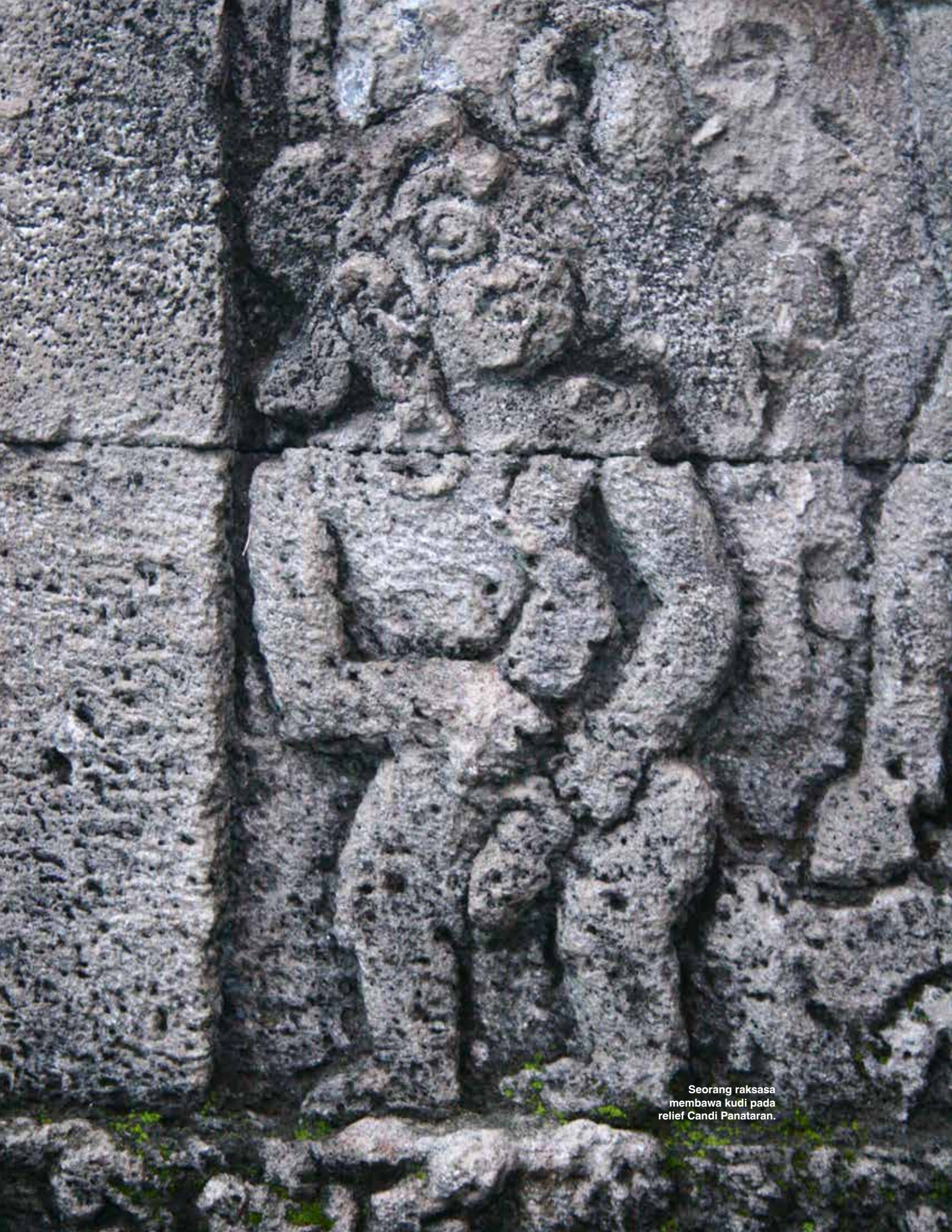
Seorang raksasa membawa kudi pada relief Candi Panataran.