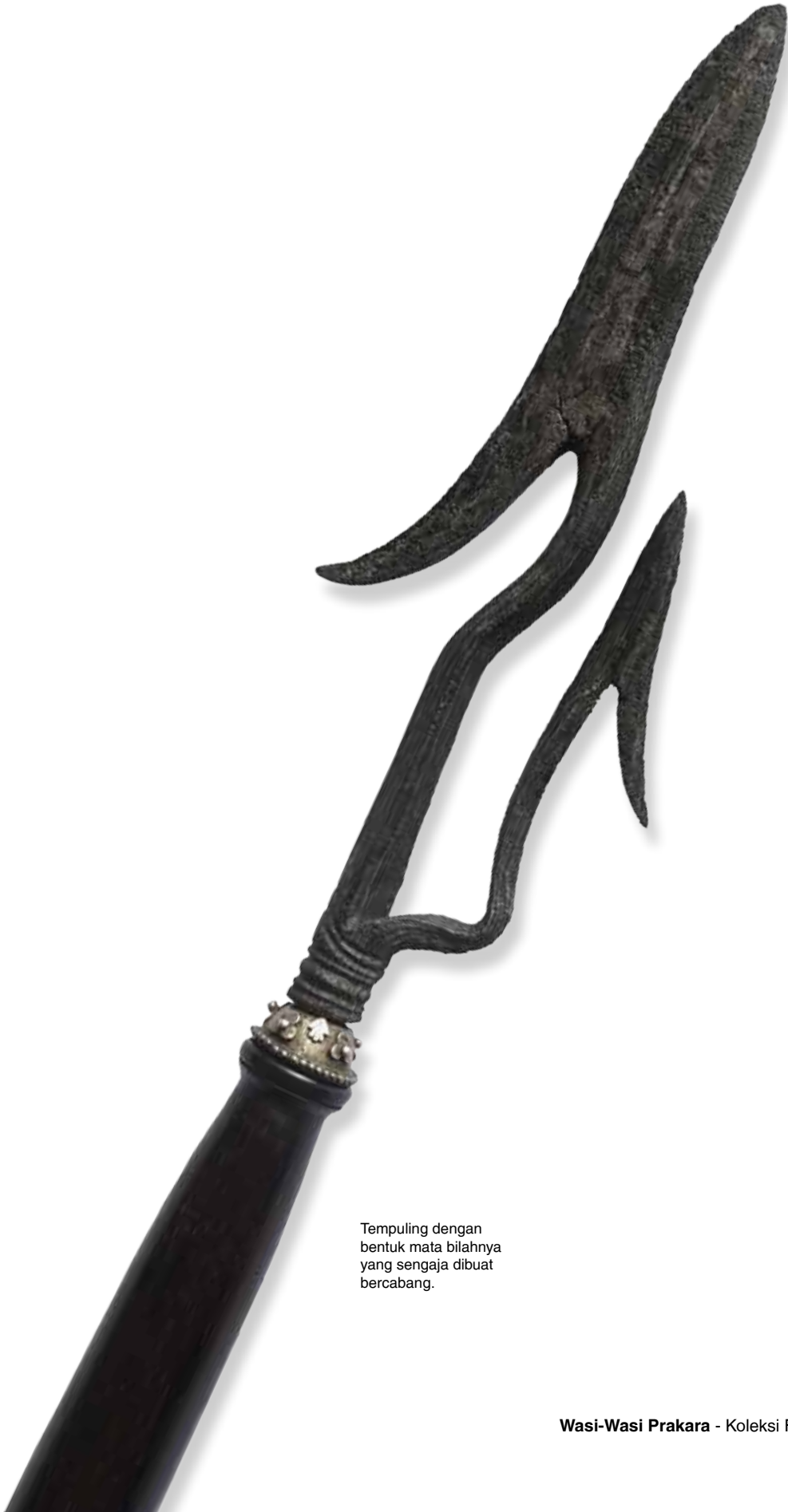
Tempuling dengan bentuk mata bilahnya yang sengaja dibuat bercabang.