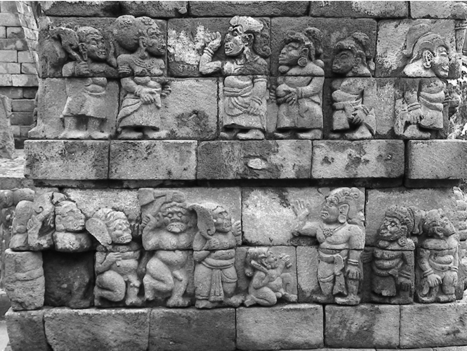
Relief Candi Suku, tampak beberapa manusia berkepala raksasa memegang wasi-wasi prakara.