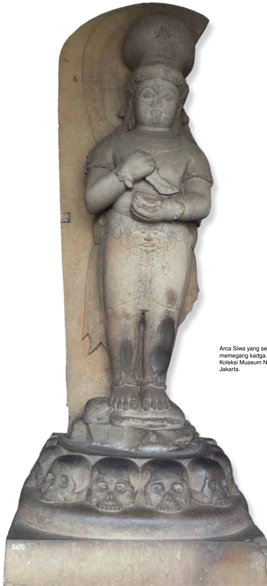
Arca Siwa yang sedang memegang kadga. Koleksi Museum Nasional, Jakarta.