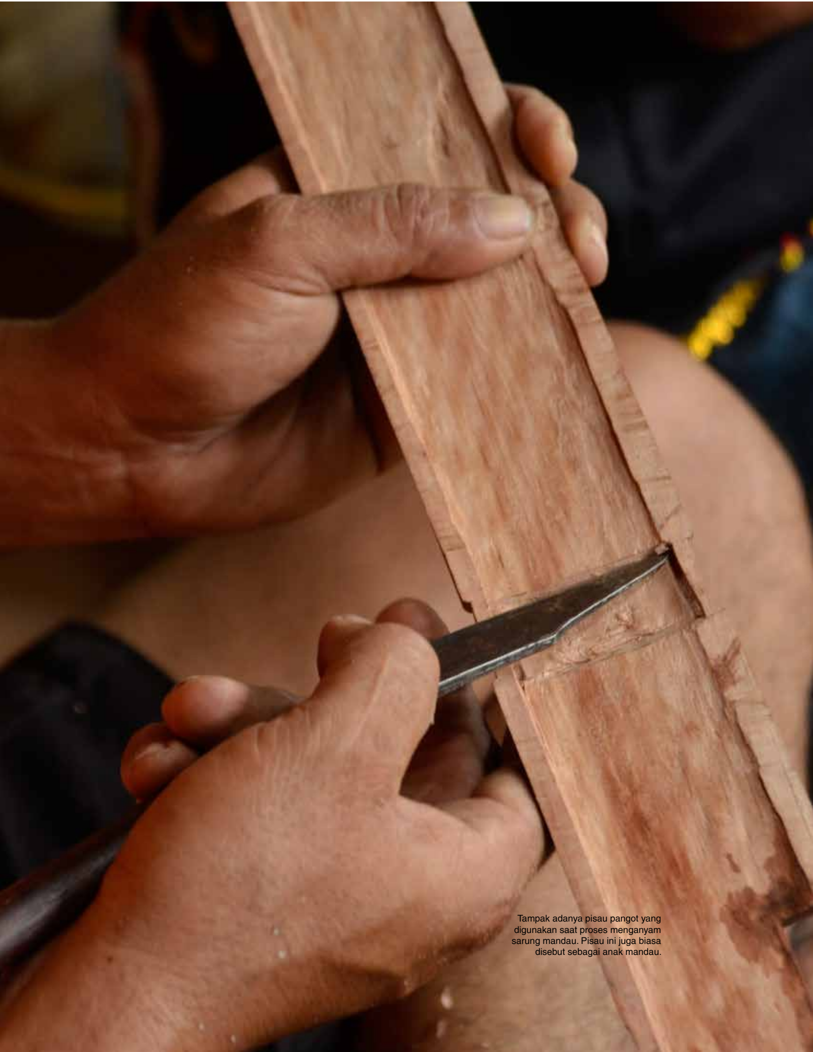
Tampak adanya pisau pangot yang digunakan saat proses menganyam sarung mandau. Pisau ini juga biasa disebut sebagai anak mandau.