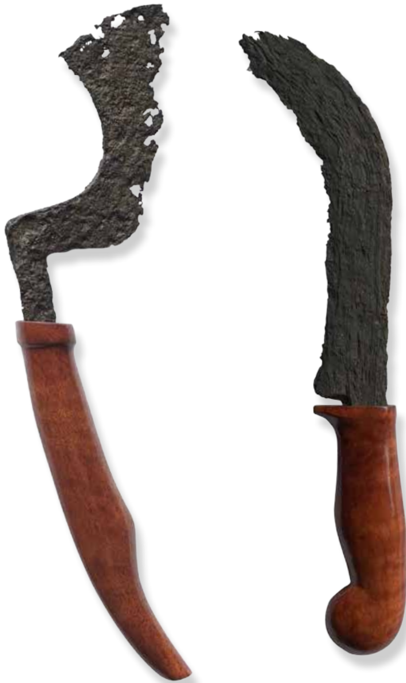
(Kiri) Artefak wasi prakara yang ditemukan di Sungai Bengawan Solo, Jawa Tengah (Kanan) Artefak wasi prakara yang ditemukan di Sungai Brantas, Jawa Timur.