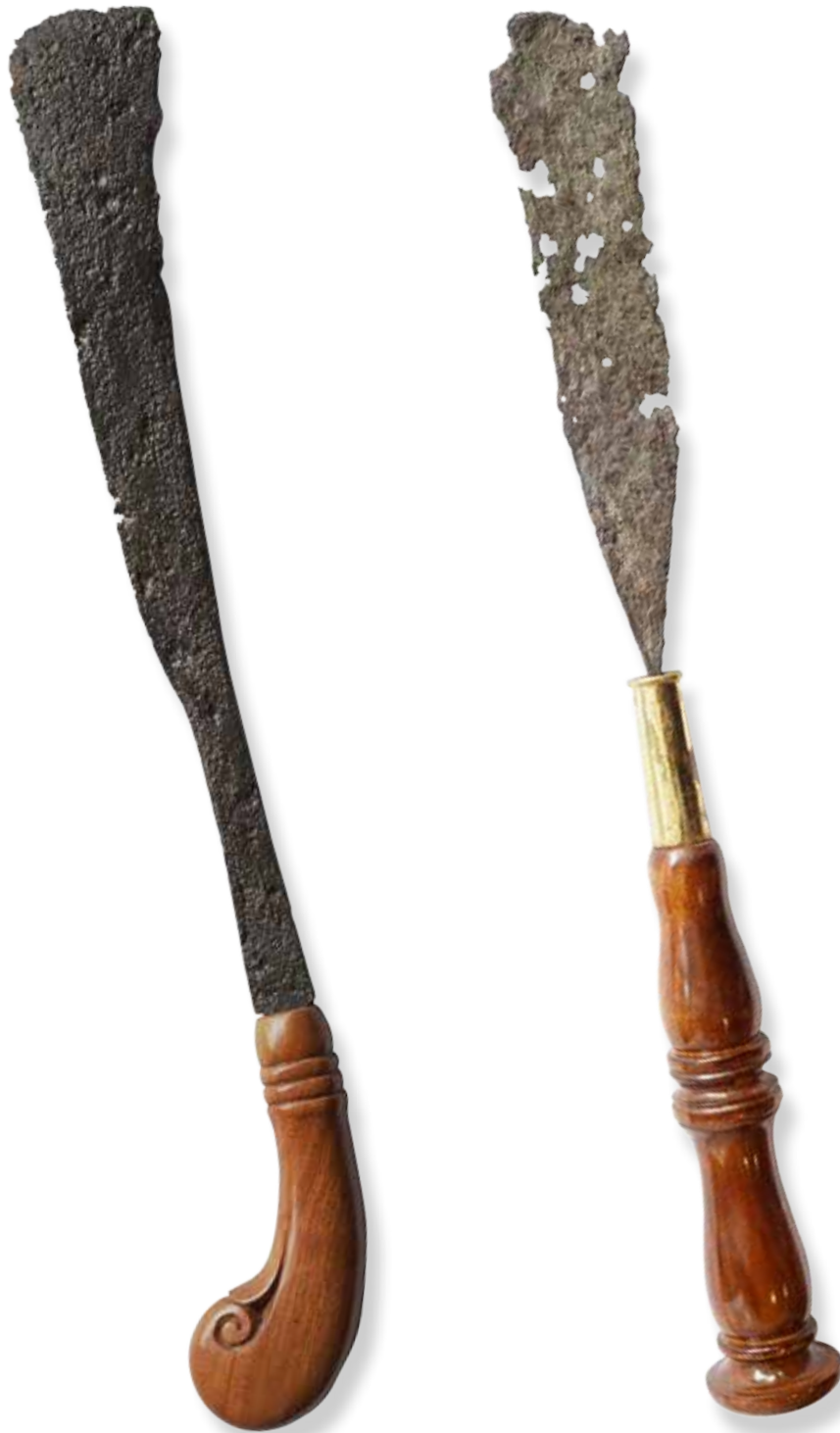
(Kiri) Artefak wasi prakara yang ditemukan di Sungai Musi, Palembang. (Kanan) Artefak wasi prakara yang ditemukan sebagai bekal kubur di Ngawi, Jawa Timur.