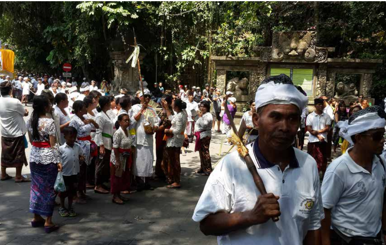
Prosesi membawa jenazah ke setra/makam dalam rangkaian upacara Ngaben di Bali, tampak seorang membawa sejenis sabit yang disebut tah.