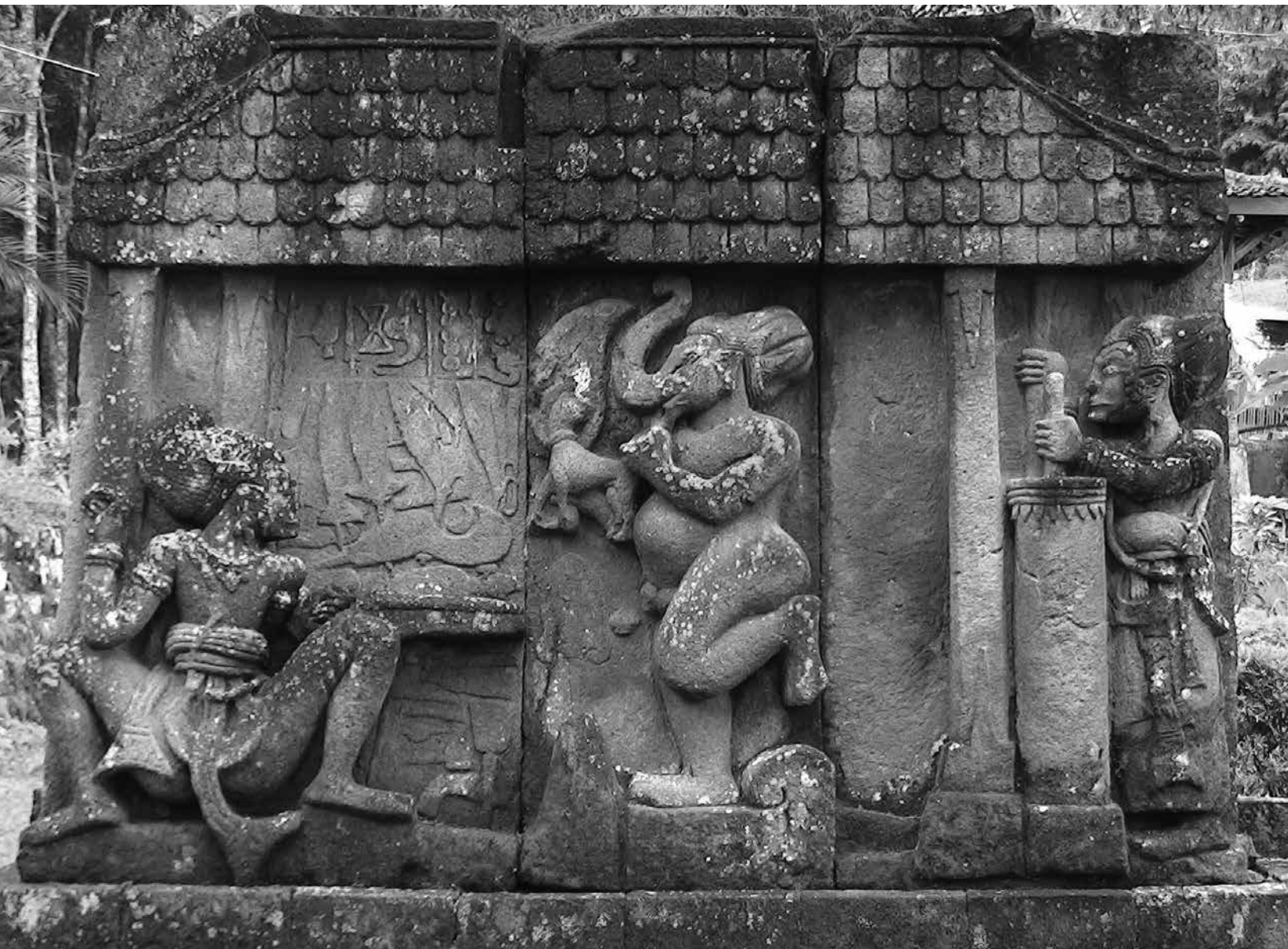
Penempatan keris dan perkakas dari besi pada relief Candi Sukuh.